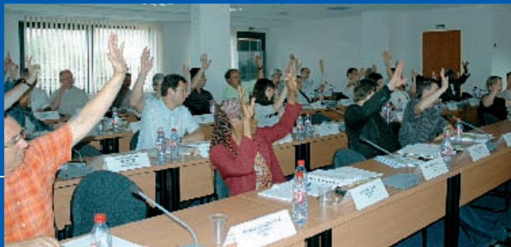
Le comité syndical de Viacités du 02 juillet 2008 a donc décidé à l'unanimité de ne pas donner suite au projet de nouveau réseau qui devait entrer en vigueur en septembre prochain. Il entérine par ailleurs la phase de concertation avec la population qui débouchera sur la mise en place d'un nouveau réseau en septembre 2009.

Pour l'année scolaire 2008-2009, le réseau restera donc maintenu dans sa configuration actuelle. Mais son évolution reste de mise. Sur les bases d'une vraie concertation cette fois. A l'occasion de la semaine de la mobilité de septembre prochain, une importante concertation sera ainsi lancée auprès de la population et des usagers. Plusieurs mois durant, dans les 29 communes de l'agglomération, chacun pourra s'exprimer sur le réseau de bus à mettre en œuvre en septembre